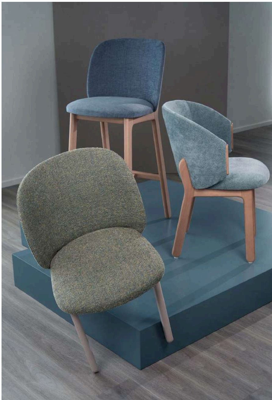
Capítulo 05, Cristo 07 , Piedade 15 (Cadeiras | Chairs)