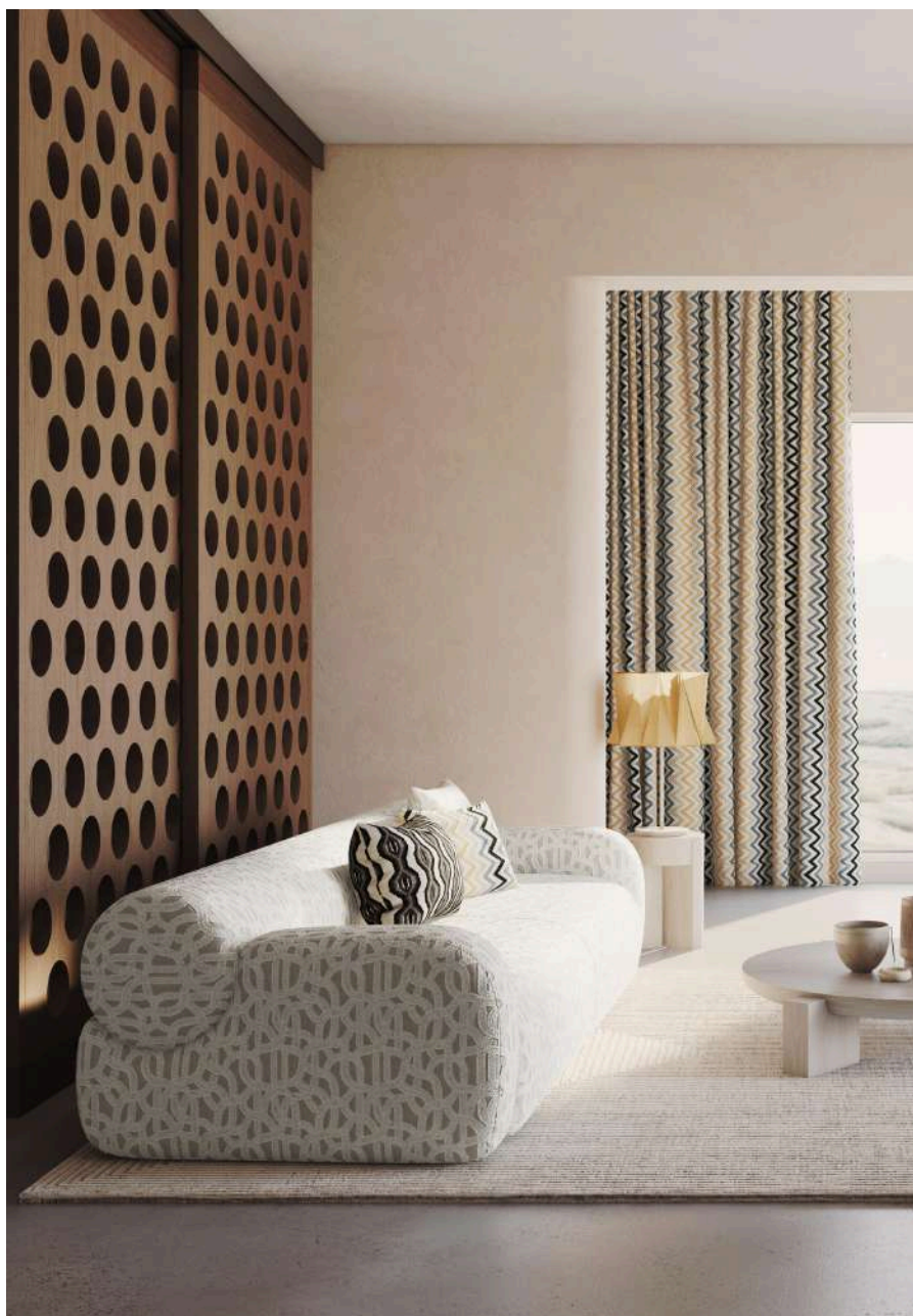
serra 05 (Sofa), Corredoura 03 (Almofada | Cushion)