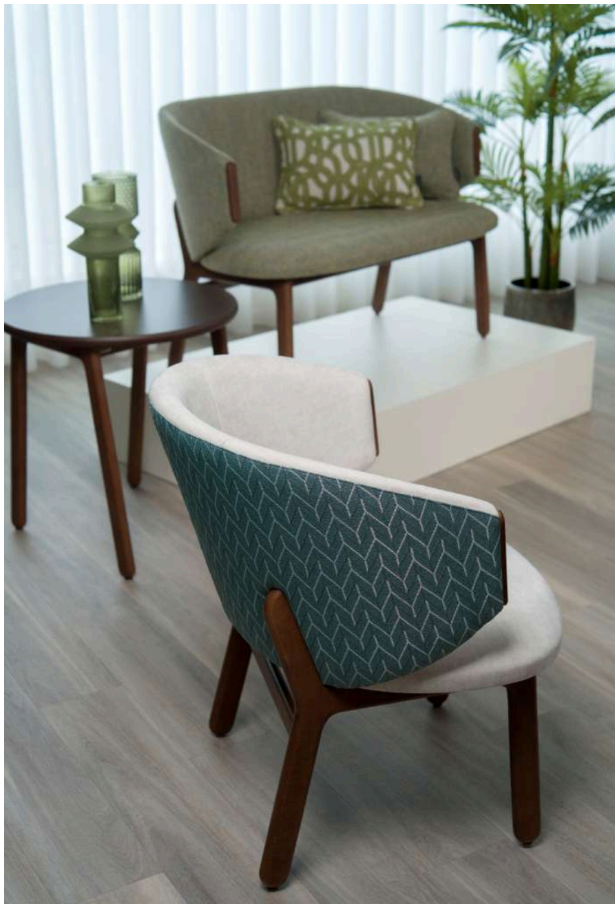
Republica 04, Roca 01 (Poltrona | Armchair)