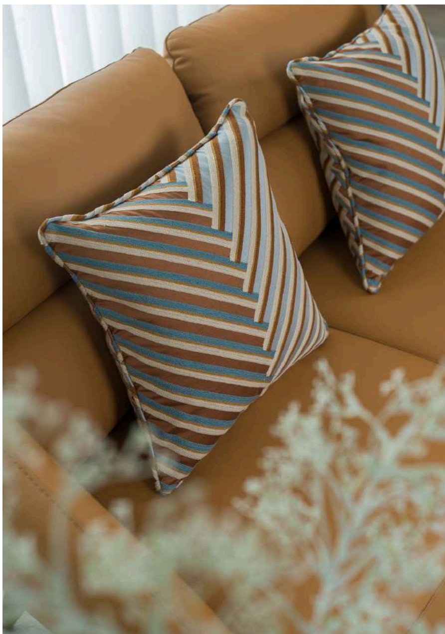
Castelo 02 (Almofadas | Cushions)