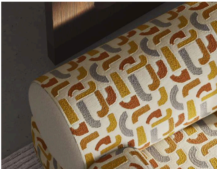
D.Manuel 26 (Sofa)