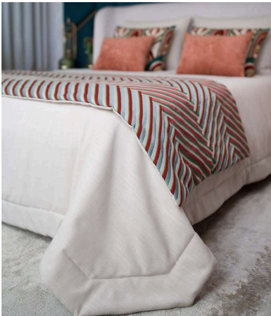
Salome 13 (Colcha | Bedspread) Castelo 01 (Cobre-pés | Bed Runner)