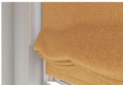
Irma 56 (Cortina | Curtain)