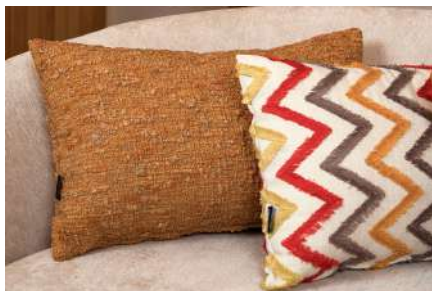
Bode 04, Madalena 27 (Almofada | Cushion)