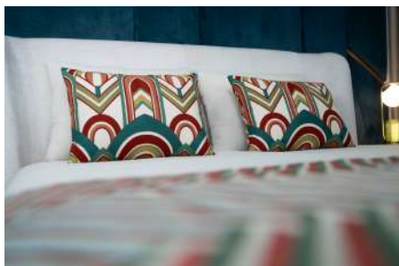
Charola 01, Travel 07 (Almofadas | Cushions)