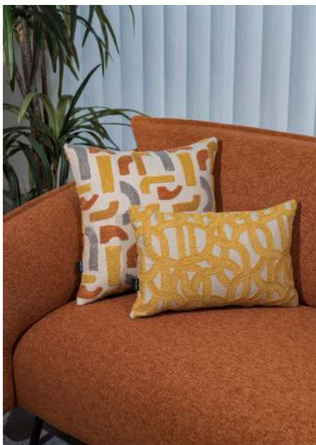
D. Manuel 26, Serra 24 (Almofada | Cushion)