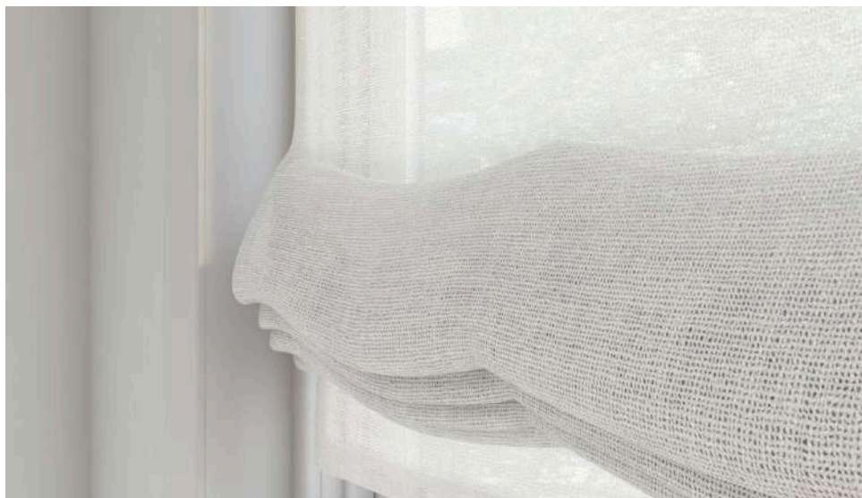
Nook 05 (Cortina | Curtain)