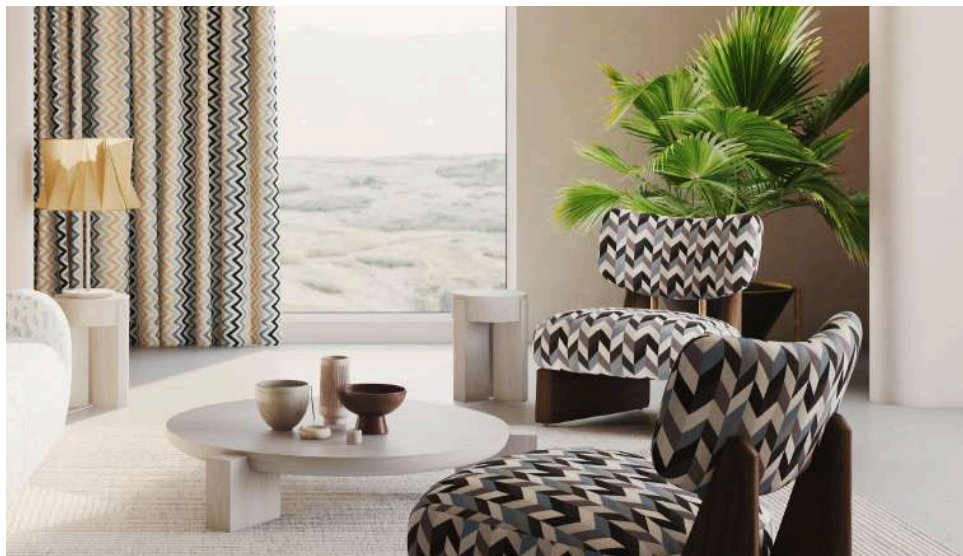
Madalena 01 (Cortina | Curtain), Fosforos 12 (Poltrona | Armchair)